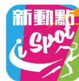
新動點(I Spot)手機應用程式