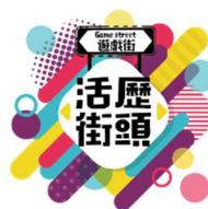
活「歷」街頭・新興運動日