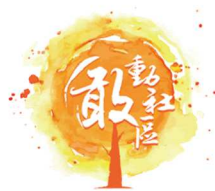
「敢」動社區・培訓計劃