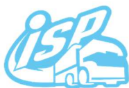
動歷快車 I-Sports Express